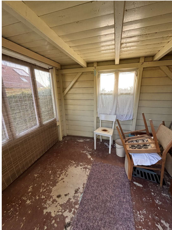
Innenansicht Nebengebäude 2