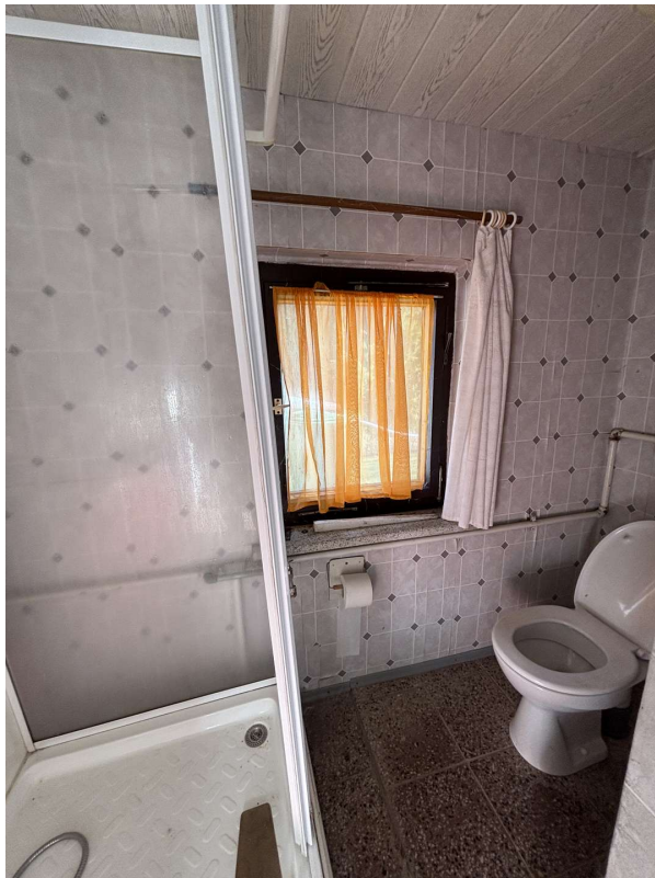
WC mit Dusche