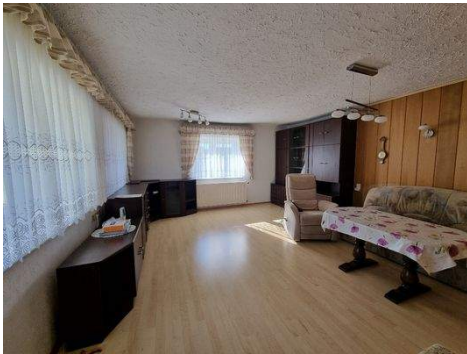
großzügiges Wohnzimmer im EG