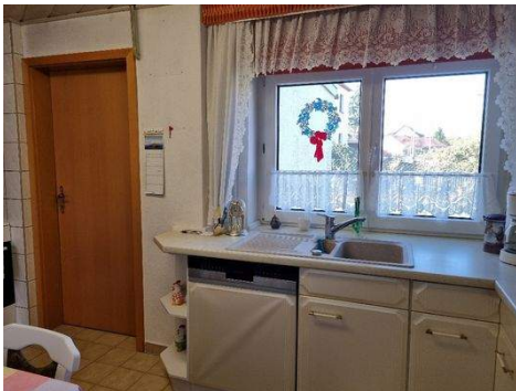
... mit Arbeitsfläche