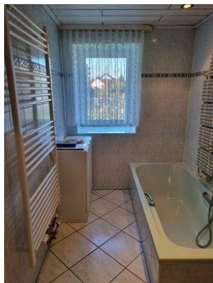
Bad mit Fenster, Wanne, Waschbecken