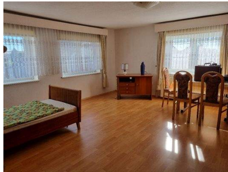
Schlafzimmer im OG