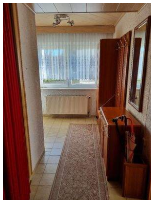
Flurbereich im EG