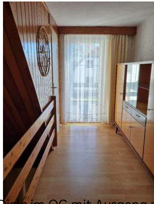
Diele im OG mit Ausgang zur Dachterrasse