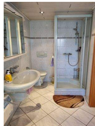
... und WC sowie Dusche