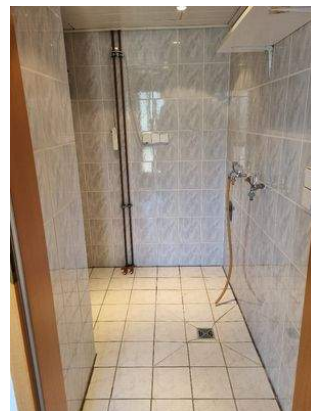
kleiner HWR mit WA-Anschluss