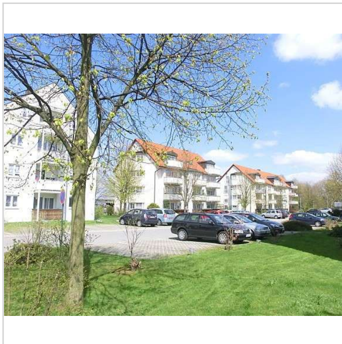
Blick in die Wohnanlage

Bischofswerda verfügt über eine sehr gute Infrastruktur und liegt verkehrsgünstig zwischen Dresden (ca. 35 km) und Bautzen (ca. 20 km). Es gibt einen ausgezeichneten Bahnanschluss sowie kurze Fahrzeiten zur Autobahn AS Burkau (ca. 4 km).