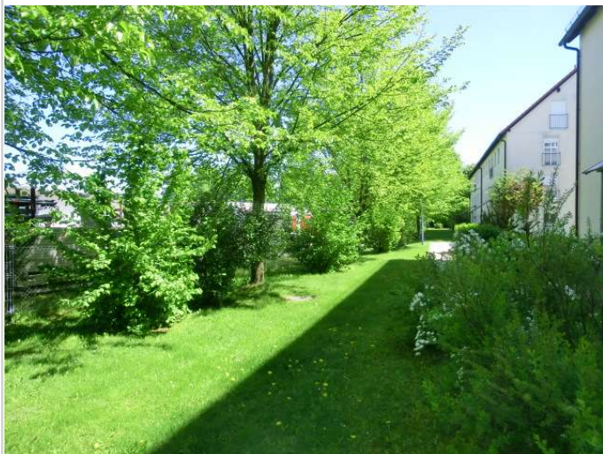
Grünbereich in der Anlage

Vermietbare Fläche: 60,31 m 2 Kaufpreis: 78.400,00 EUR Kaufpreis pro m 2 : 1.300,00 EUR