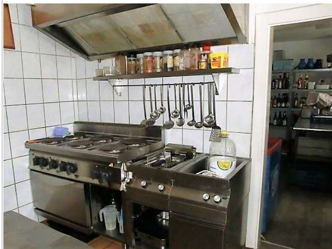
Teil in der Küche

Vermarktungsart: Kauf Gastraumfläche: 122,00 m 2 Gesamtfläche: 356,00 m 2 Kaufpreis: 250.000,00 EUR