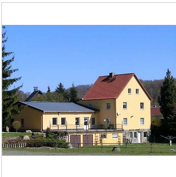
Ensemble mit Wohnhaus

Ringenhain hat einen Busanschluss, ein kulturelles Leben mit verschiedenen Vereinen und nahen Freizeiteinrichtungen. Das Lausitzer Bergland an der Grenze zu Böhmen mit Wäldern und Teichen bietet reichlich Freizeitmöglichkeiten.