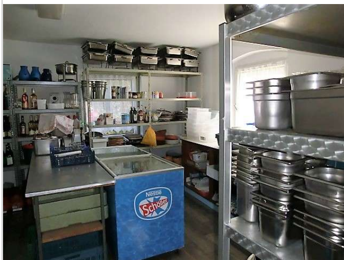
sep. Raum an Küche