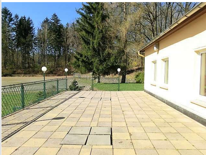
Blick von Terrasse