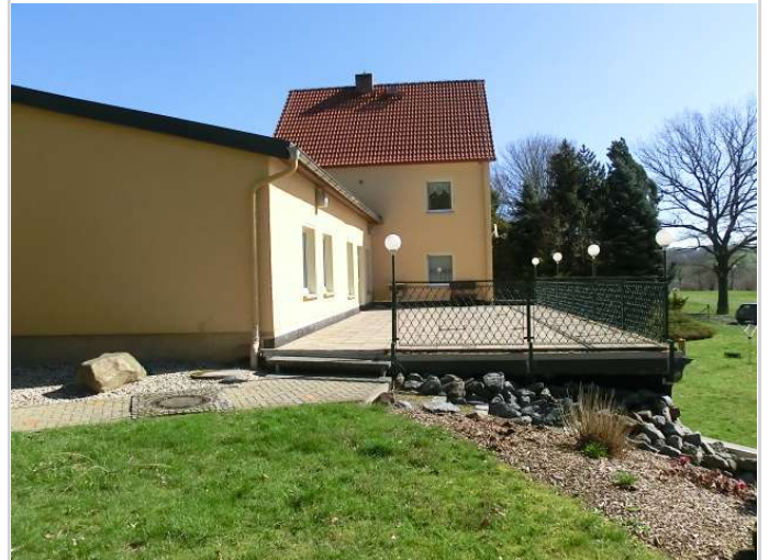
Ansicht zur Terrasse