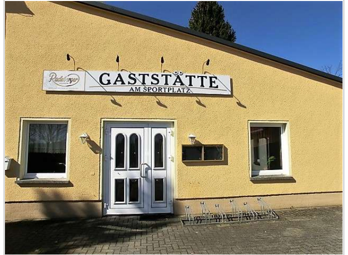
Eingang zur Gaststätte