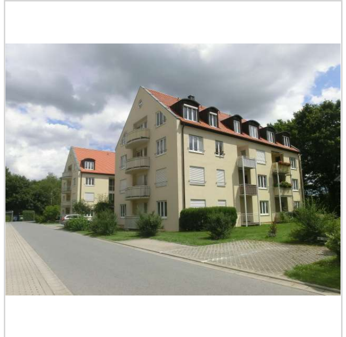
Komplex Haus 1

Bischofswerda verfügt über eine sehr gute Infrastruktur und liegt verkehrsgünstig zwischen Dresden (ca. 35 km) und Bautzen (ca. 20 km). Es gibt einen ausgezeichneten Bahnanschluss sowie kurze Fahrzeiten zur Autobahn AS Burkau (ca. 4 km).