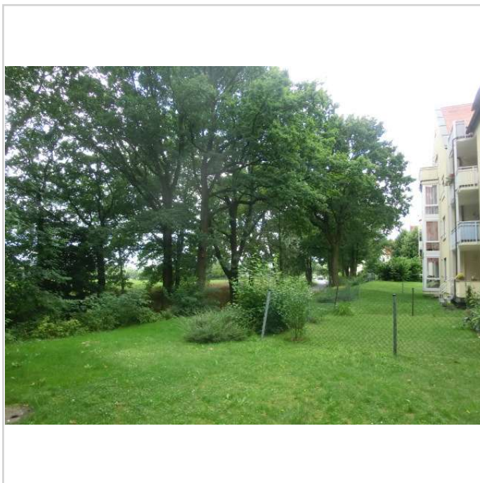
Bereich hinter dem Wohnhaus