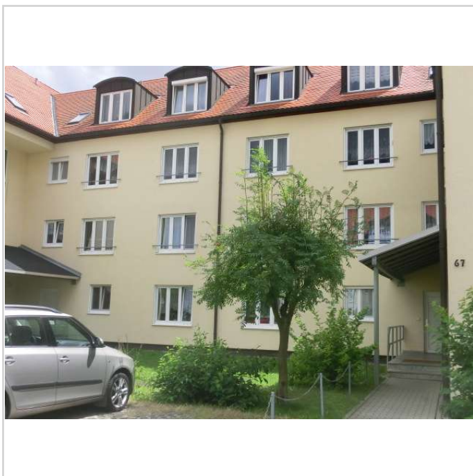
Blick zu den Gauben

Zimmer: 2,00 Wohnfläche ca.: 38,50 m 2 Kaufpreis: 53.200,00 EUR