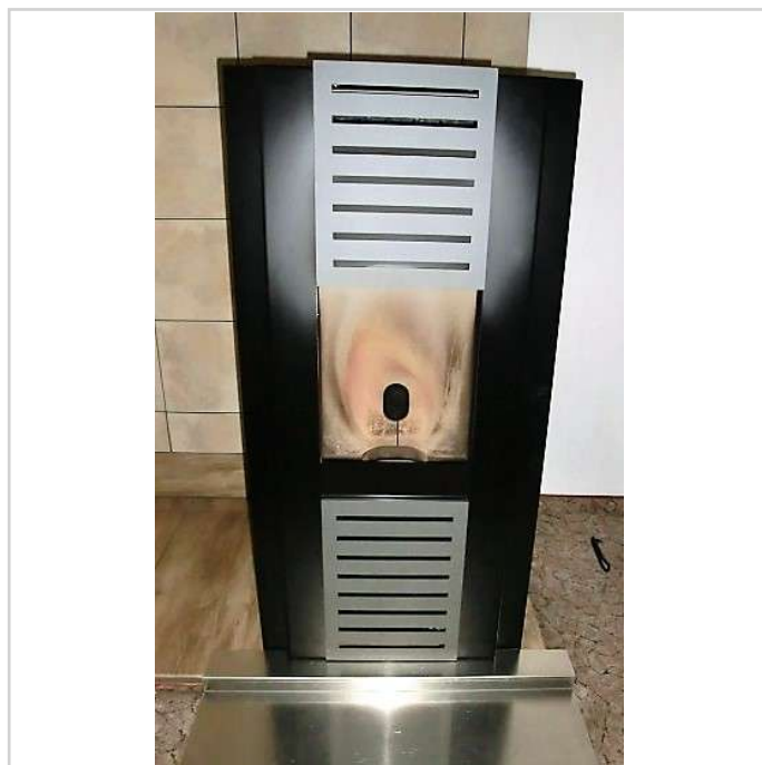
... mit Pelletofen