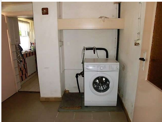
HWR im Anbau