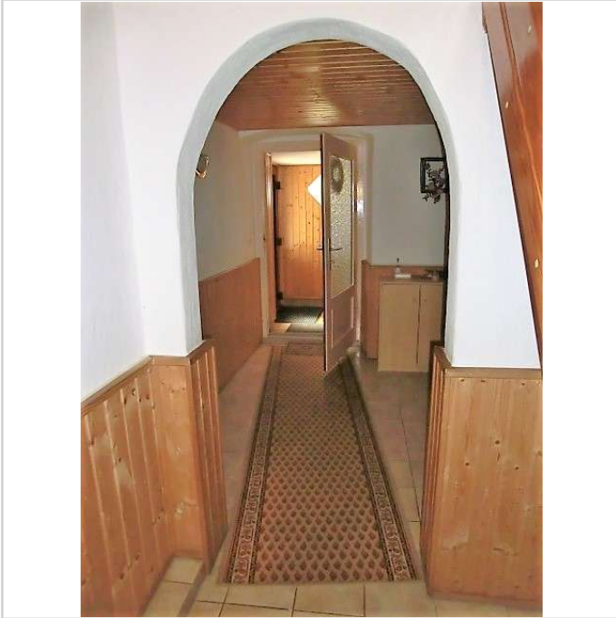
Flur im Erdgeschoss

Zimmer: 3,00 Wohnfläche ca.: 70,00 m 2 Kaufpreis: 85.000,00 EUR