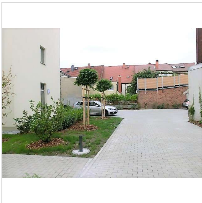
Innenhof mit Stellplätzen