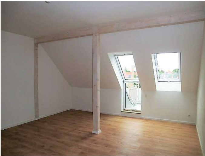
Sichtbalken im Wohnbereich

Zimmer: 2,00 Wohnfläche ca.: 62,70 m 2 Kaltmiete: 486,00 EUR (zzgl. Nebenkosten) Gesamtmieta: 676,00 EUR