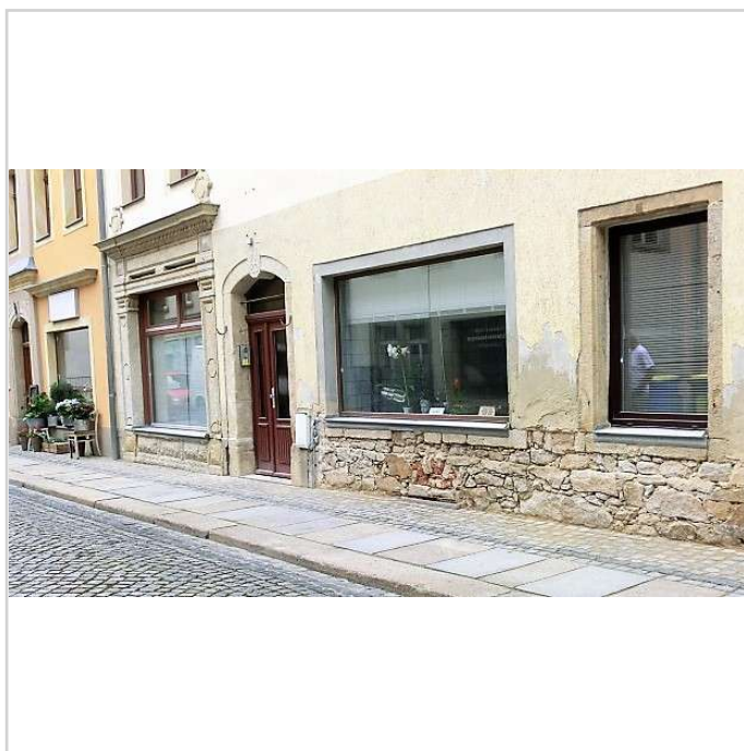
Ladenansicht mit Charme

Die Gewerbeeinheit befindet sich an der Bautzener Straße, nur wenige Meter vom Marktplatz entfernt. Bischofswerda verfügt über eine ausgezeichnete Infrastruktur und hat ein attraktives Gewerbe- sowie ein Industriegebiet. Verkehrsgünstig erreicht man die Autobahn A4 in wenigen Minuten mit dem Pkw und die Bundesstraßen B 6 und B 98 führen durch den Ort. Die Landeshauptstadt Dresden liegt nur 35 km und Bautzen nur 18 km entfernt.