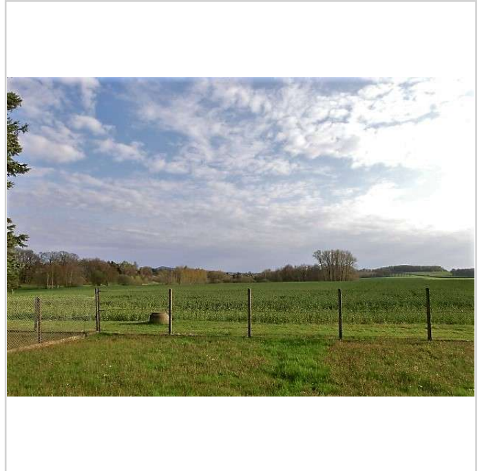
Blick hinter dem Grundstück