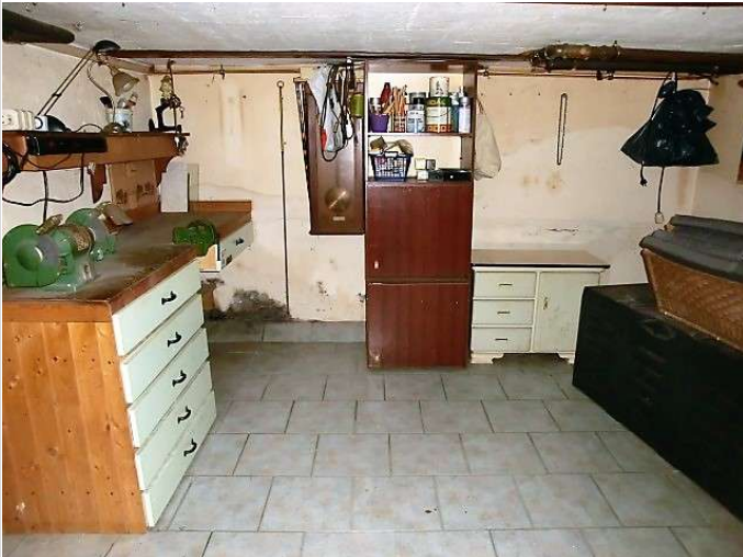
Werkstatt im Keller