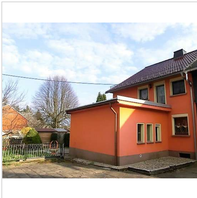
Ansicht mit Garagenanbau

Der kleine Ortsteil grenzt an die Große Kreisstadt Bischofswerda. Der Stadtkern ist nur ca. 4 km entfernt. Bischofswerda mit ausgezeichnetem Bahnanschluss verfügt über eine sehr gute Infrastruktur und liegt verkehrsgünstig zwischen Dresden (38 km) und Bautzen (20 km). Die Autobahn A 4, AS Burkau erreicht man in 5 km.