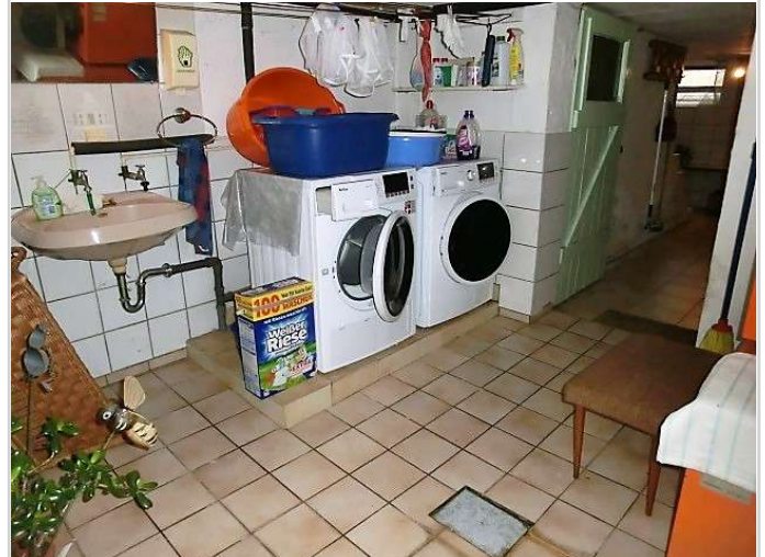
Hauswirtschaftsraum im KG