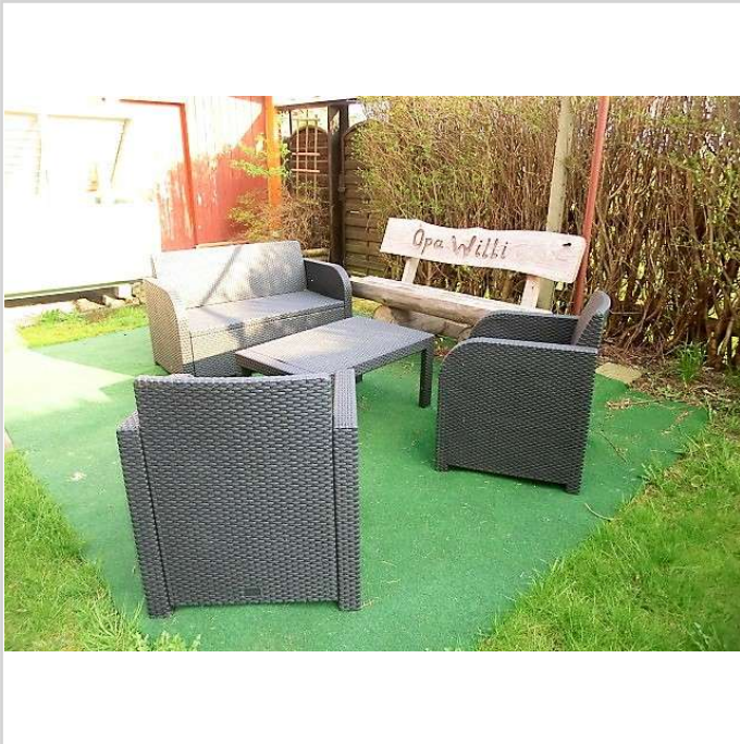
Sitzecke im Garten

Zimmer: 4,00 Wohnfläche ca.: 120,00 m 2 Kaufpreis: 185.000,00 EUR