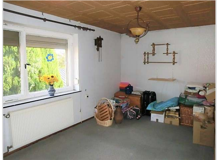
Raum im OG