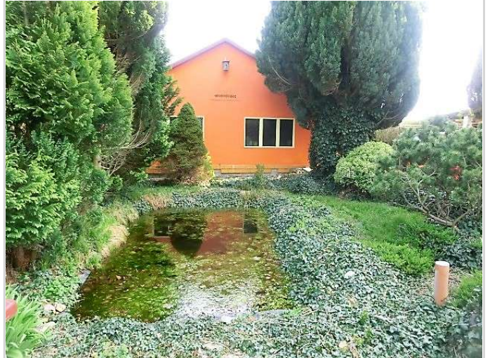
Blick zum Teich u. Garage