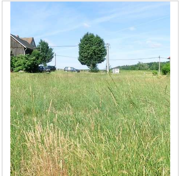
Blick zur Straßenseite

Rammenau ist ein sehr attraktiver und über die Grenzen hinaus bekannter Ort mit Barockschloss, reizvoller Landschaft mit Teichen und sehr gepflegten Wohnhäusern. Hier gibt es eine gute Infrastruktur mit Einkaufsmöglichkeiten, Gaststätten, KITA, kulturellen und sportlichen Angeboten sowie Gewerbetreibenden. Verkehrsgünstig erreicht man die Autobahn A 4, AS Burkau in nur 3 km.