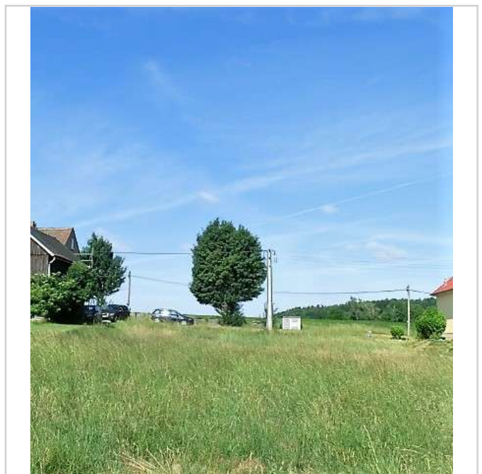
Blick von Grundstücksrand